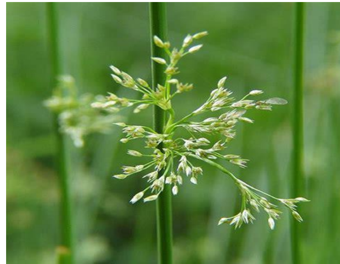
Juncus effusus (jonc diffus)

Prof. : 0/-10 cm Haut. : 40 à 80cm Dens. :10/20 m 2 Flles : vert jaunâtre Flrs : mai/août Lumière /mi-ombre