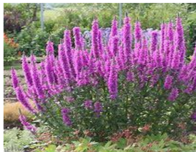
Lythrum salicaria robert (Salicaire)

Prof. : 0/-10 cm Haut. : 30 à 150cm Dens. : 10 à20/ m 2 Flles. : vert foncé Flrs : rose vif (juin/septembre) Lumière/mi-ombre