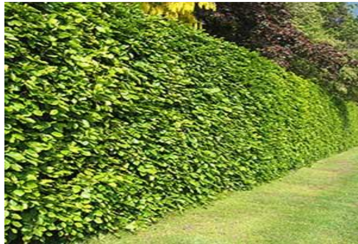
Hêtre vert (fagus sylvatica)

Port Etalé bas Taille adulte : 5m x 5m Saison floraison : Hiver Exposition : Soleil, Mi-ombre Feuillage : Caduc Rusticité : Rustique (T° mini : -15°) Humidité sol : Frais