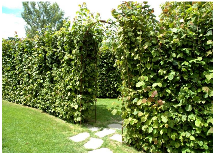
Noisetier commun (Corylus avellana 'Merveille de Bollwiller')