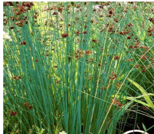
Juncus inflexus glaucus (jonc glauque)

Prof. : 0/-20 cm Haut. : 60 à 150cm Dens. :5/10 m 2 Flles : vert jaunâtre Flrs : mai/juin Lumière /mi-ombre