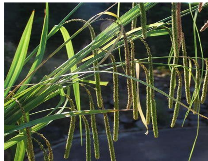
Carex pendula (laïche pendante)

Prof. : 0/-10 cm Haut. : 28 à 80cm Dens. :10/20 m 2 Flles : vert glauque Flrs : juin/août Lumière /mi-ombre