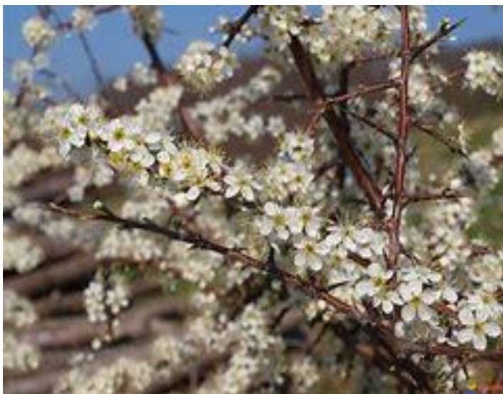
Prunellier (Prunus spinosa)