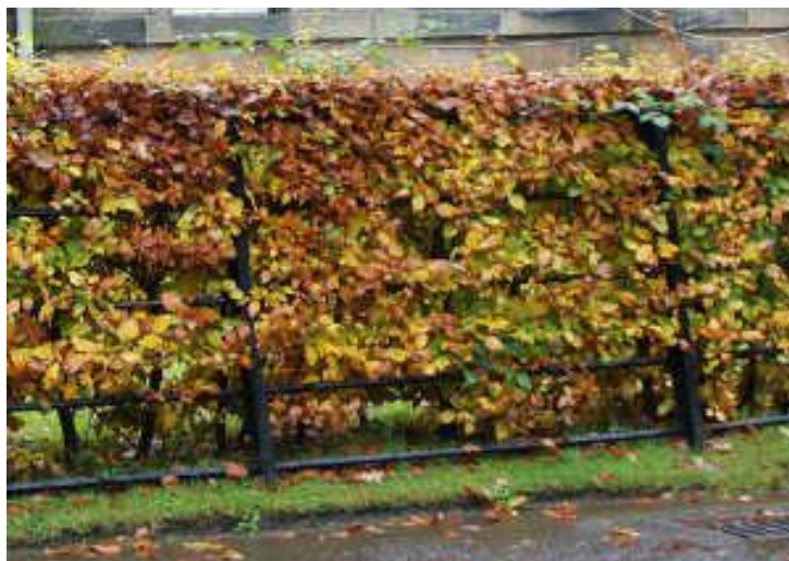
Charme commun (Carpinus betulus)