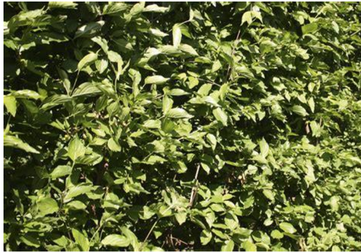
Cornouiller mâle (Cornus mas)