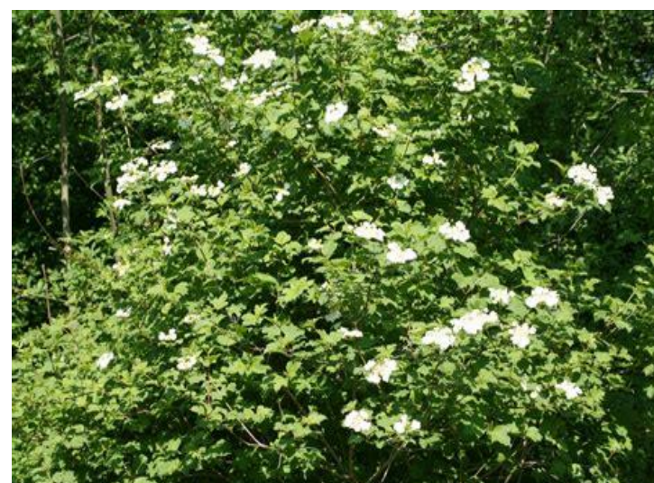
Viorne Obier (viburnum opulus compactum)