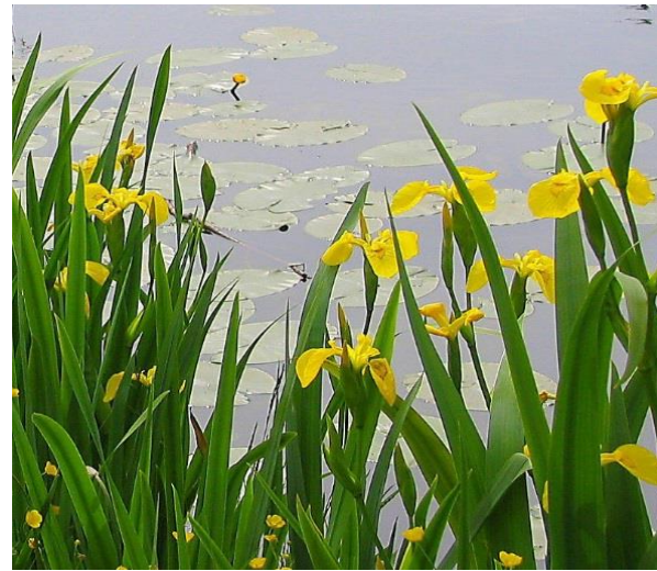
Iris pseudo Acorus (Iris faux acore)

Prof. : 10/-40 cm Haut. : 40 à 150cm Flles : vert Glauque Flrs : jaune vif (mai/juin) Lumière /ombre