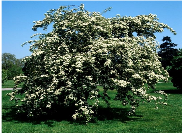
Aubépine, épine blanche (Crataegus monogyna)