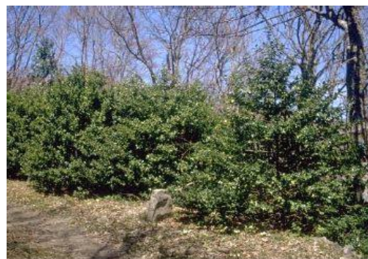
Houx commun (ilex aquifolium)